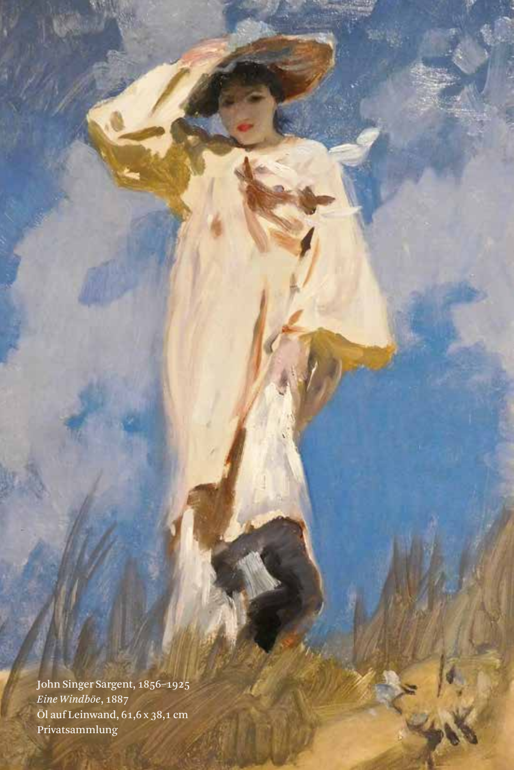
John Singer Sargent, 1856–1925 Eine Windböe , 1887 Öl auf Leinwand, 61,6 x 38,1 cm Privatsammlung