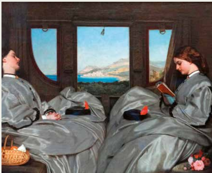
Augustus Leopold Egg, 1816–1863 Die Reisegefährtinnen , 1862 Öl auf Leinwand, 65,3 x 78,7 cm Birmingham Museum & Art Gallery