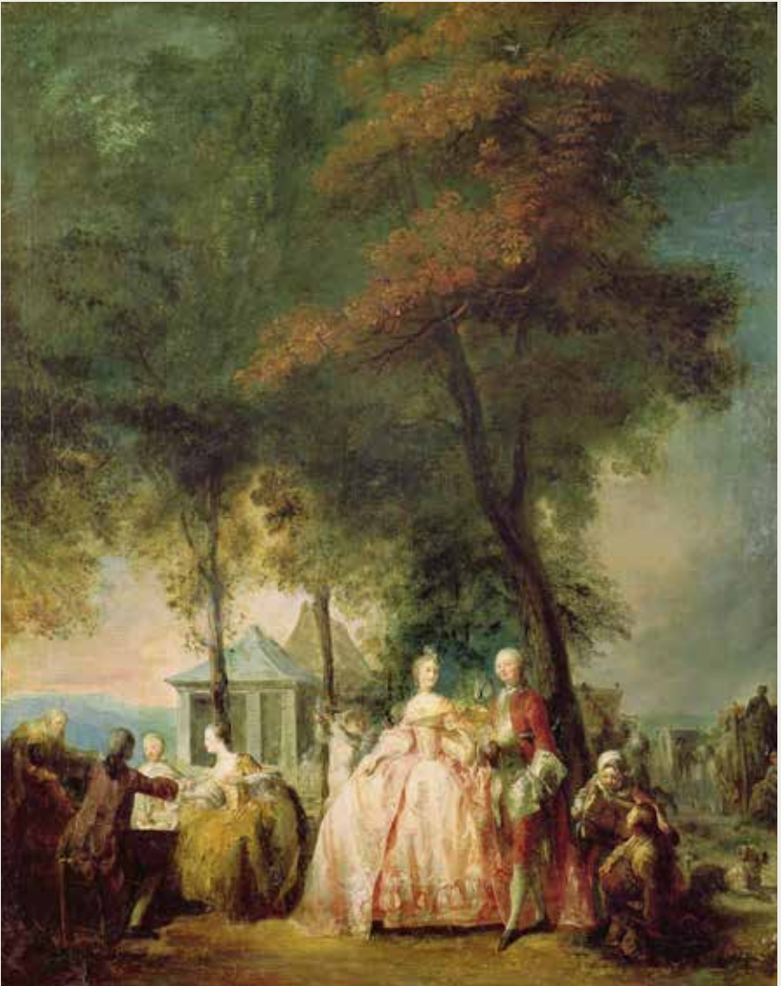
Gabriel de Saint-Aubin, 1724–1780 Promenade in Longchamp , um 1760 Öl auf Leinwand, 80 x 83 cm Perpignan, Musée Hyacinthe Rigaud