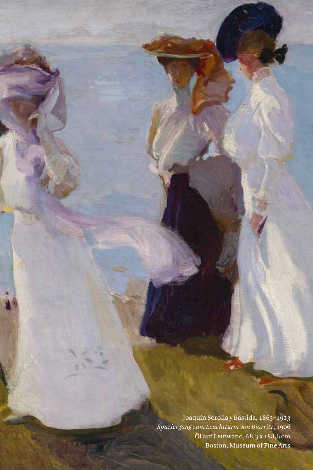
Joaquín Sorolla y Bastida, 1863–1923 Spaziergang zum Leuchtturm von Biarritz , 1906 Öl auf Leinwand, 68,3 x 188,6 cm Boston, Museum of Fine Arts