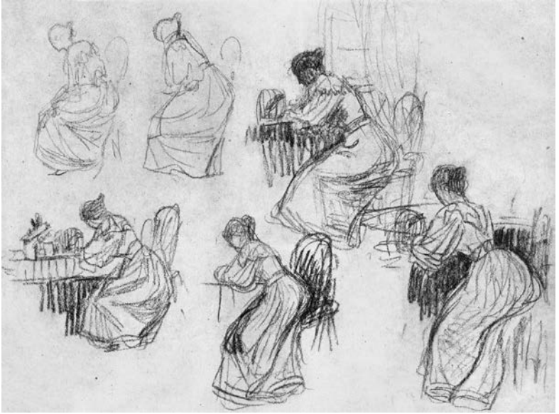
Otto Modersohn, Paula Becker, am Tisch schreibend , um 1900